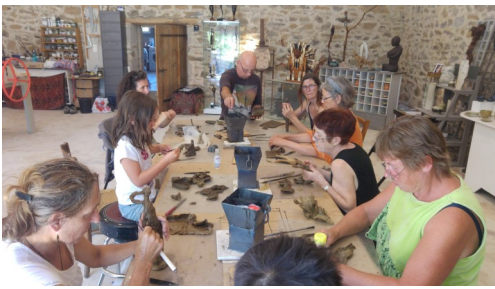
Atelier modelage : Création par chaque stagiaire d'une œuvre originale et unique en cire d'abeille...